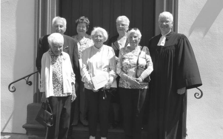
Die sechs Gnadenkonfirmandinnen und – konfirmanden.

Am 11. Juni feierten wir in der Weningser Kirche Eiserne Konfirmation (65 Jahre), Gnadenkonfirmation (70 Jahre), Kronjuwelkonfirmation (75 Jahre) und Eichenkonfirmation (80 Jahre).