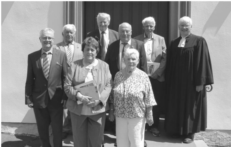
Die sieben Eisernen Konfirmandinnen und Konfirmanden.